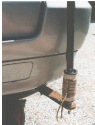
Figura 5 - Matching coil per cercare il migliore accoppiamento fra cavo coassiale e antenna

Il capo inferiore della bobina è a massa mentre il centrale del cavo coassiale è connesso ad un coccodrillo col quale si va a cercare la spira più adatta per ottenere il minore ROS alla risonanza. Il capo superiore della bobina è saldato al filo che