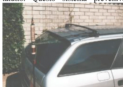
Figura 8 - Barre stabilizzatrici

Con la barra portatutto installata, la soluzione più semplice era l'uso di due bacchette rigide installate a V e fissate ai due estremi della barra portatutto. Questo sistema preveniva