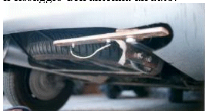
Figura 3 - Il supporto retratto

L'aspetto che più mi ha impegnato è stato la definizione del supporto per il fissaggio dell'antenna all'auto.