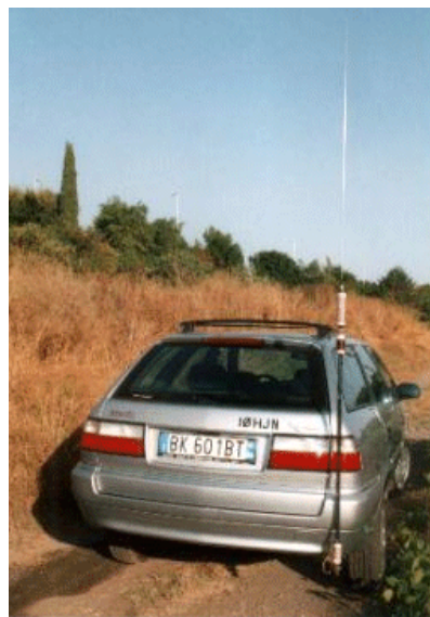
Figura 2 - La Citroen Xantia pronta a partire per gli interventi di Emergenza, Field day o Contest

informazioni in Internet. L'argomento è ampiamente trattato in numerosi