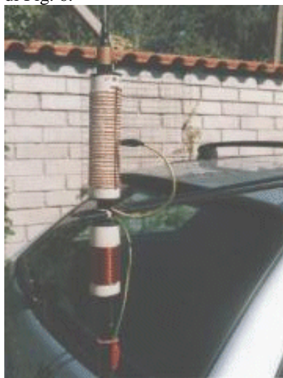
Figura 6 - Loading coil e bobina dei 40m

Inizialmente ho fatto le prime prove elettriche con la sola bobina centrale di carico ed ho potuto constatare che con tutta la bobina inserita, la minima frequenza raggiungibile era di circa 12 MHz. Allungare la Loading coil per arrivare a coprire anche i 40 sarebbe risultato in una bobina eccessivamente lunga a causa della necessità di mantenere la spaziatura di 5 mm fra le spire. Questo mi ha indotto alla costruzione della bobina addizionale per i 40 metri (quella con le spire ravvicinate) visibile nella foto di Fig. 6.